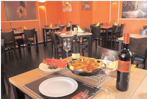
"Las Olas" in der Hattinger Altstadt

Fortsetzung von Seite 1 55). Am So. kann man sich hier mit einem Brunch von 10.00 bis 15.00 Uhr einmal so richtig verwöhnen lassen. (Preis: 12, 50 Euro / Ki. bis 12 J.: 0,50 Euro pro Lebensjahr / Ki. von 0 bis 2 J. frei. Gesonderte Preise für Feiertage. Reservierung erbeten.). Gern gesehene Gäste sind hier Kinder, für die es extra "Bambini-Menüs", Kinderstühle und jeden 1. So. im Monat Kinder-Pizza-Backen gibt. Damit keine Langeweile aufkommt, gibt es einen Kinderspielraum und Spielgeräte im Außenbereich.