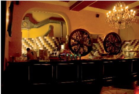
"Fabbrica Italiana" im Alten Hattinger Bahnhof