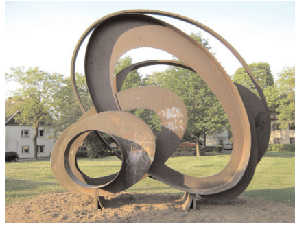
Die auf den Bebelplatz versetzte Karl Prasse Plastik

der Thing- und in der Marxstraße befinden sich genügend Möglichkeiten für den täglichen Bedarf einzukaufen. Neu ist auch der historische Stadt-teilrundgang der mit Hilfe der Gartenstadt Hüttenau realisiert wurde.